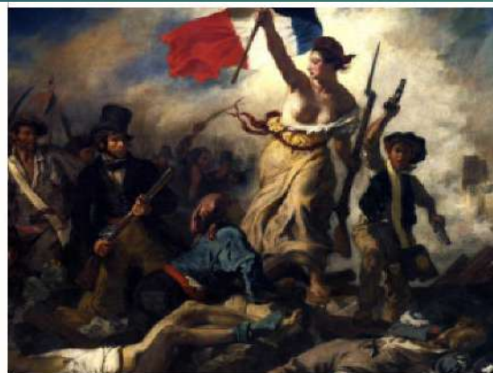
Delacroix, E. (1830). La libertad guiando al pueblo . París, Francia: Museo del Louvre.