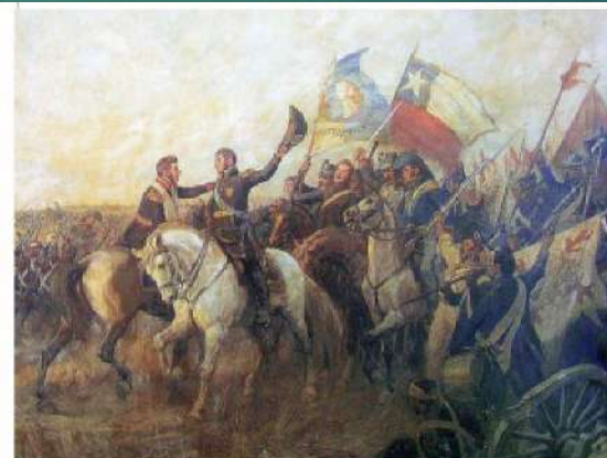
Subercaseaux, P. (1908). Abrazo de Maipú . Buenos Aires, Argentina: Museo Histórico Nacional. (Detalle).